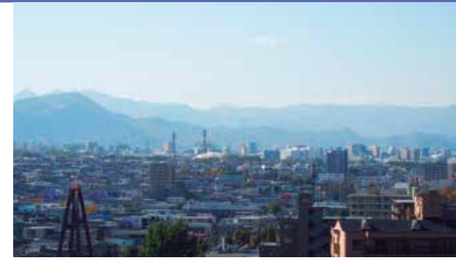
▲C館7Fラウンジからの眺め