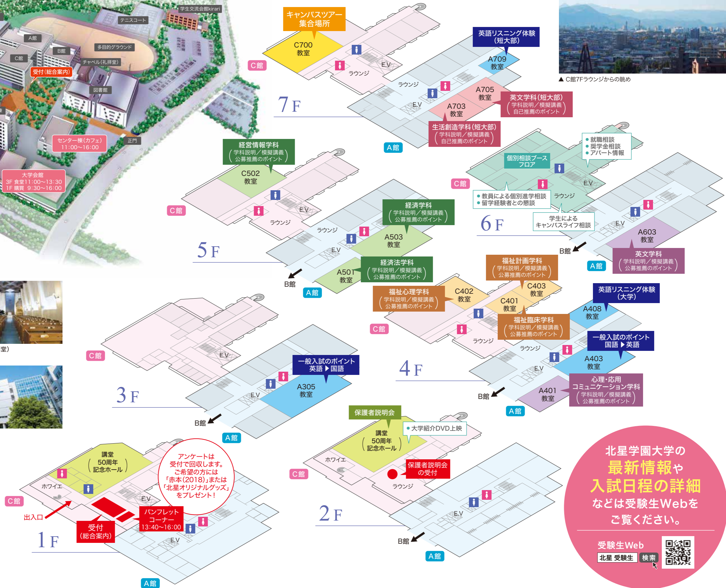
▲ C館7Fラウンジからの眺め