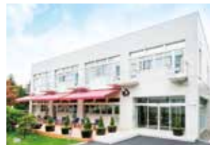
センター棟 ●1F カフェ 11:00~16:00