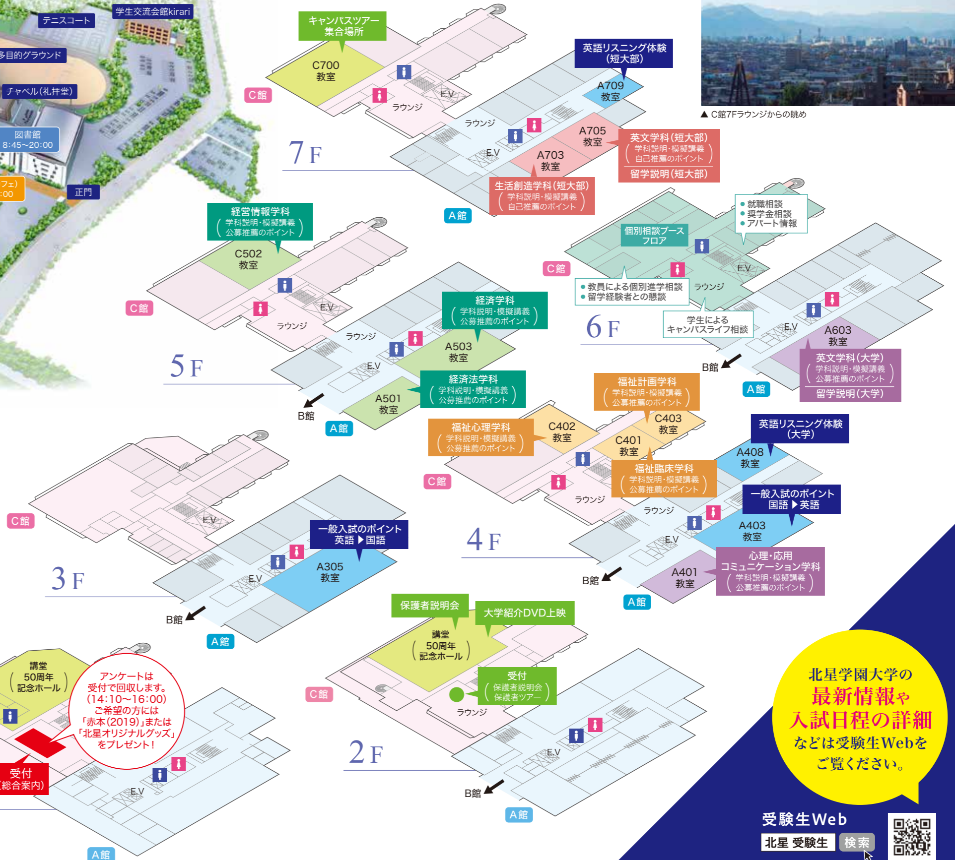
▲C館7Fラウンジからの眺め

北星学園大学の 最新情報 や 入試日程の詳細 などは受験生Webを ご覧ください。