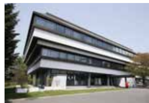
大学会館 ●3F 食堂 11:00~13:30 ●1F 購買 9:30~16:00